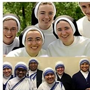
Vocaciones para Mujeres