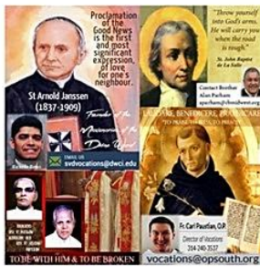
Voc. Religiosas - Hombres