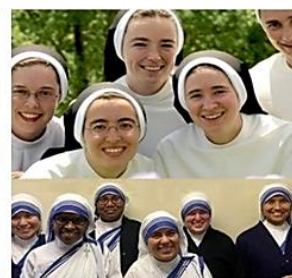
Vocaciones para Mujeres