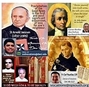
Voc. Religiosas - Hombres